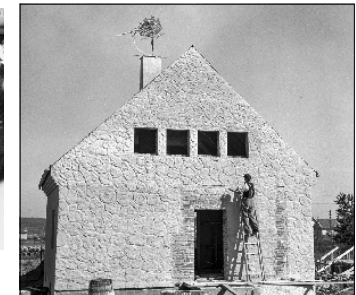
MUNKEPUSS: En murer er i gang med den karakteristiske murpussen som flere av husene fortsatt har.