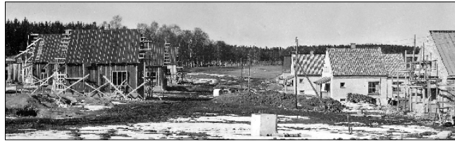
TRE OG MUR: Mellom husene ble det anlagt et tolv meter bredt parkbelte til felles benyttelse for huseierne.