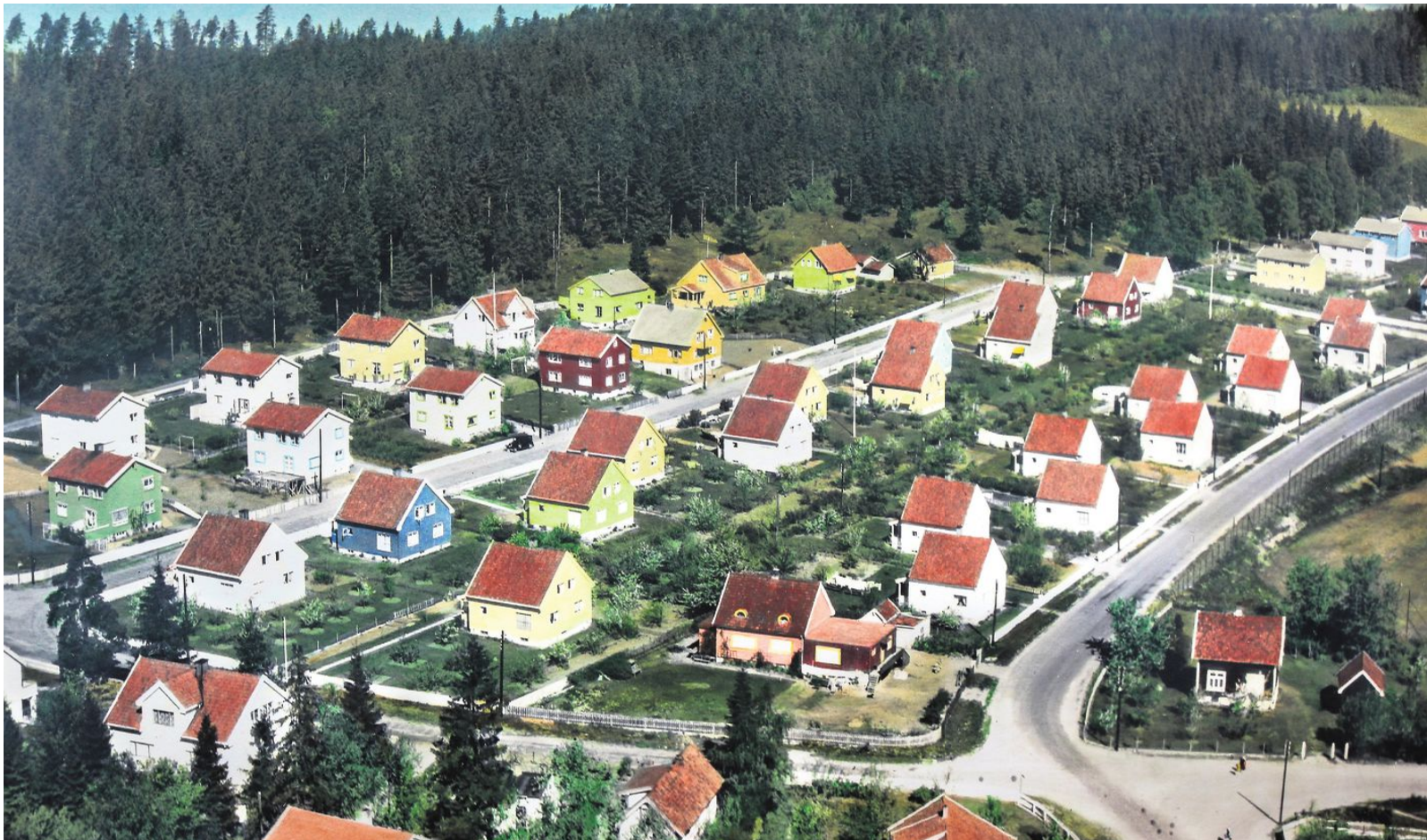
HELE KVARTALET I 1953: Sambygg-prosjektet omfattet 23 boliger. Husene i Bjerkealleen på vestsiden ble oppført i tre - i Ole O. Lians gate ble det bygd murhus. Til høyre utenfor bildet ligger Bellevue idrettsplass som ble opparbeidet på dugnad i 1933-34.