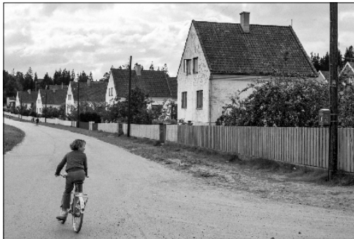
12. SEPTEMBER 1962: En helt vanlig hverdag i Ole O. Lians gate.